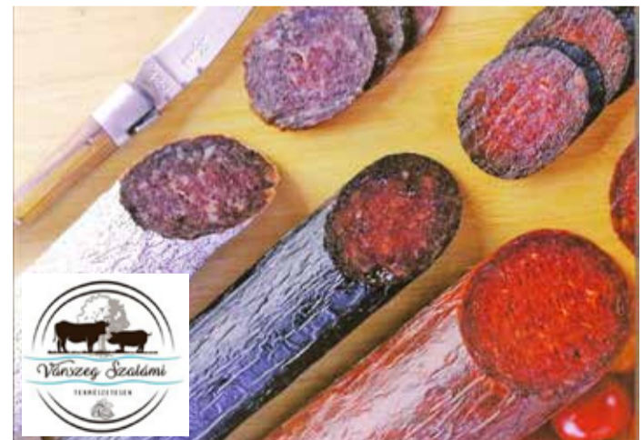
Várszeg szalámi – bio-finomságok Húsvétra

Szezonálisan működik a Várszeg Szalámi Mintabolt a szentmihályi Tordai utcában. Karácsony előtt indul a szezon, s a természetes tartásból származó alapanyagok húsvétig még bizonyosan kitarthatnak. Kedvező áron kaphatók a Fadd-Várszegi természetközeli gazdaságban készült feldolgozott, füstölt, garantáltan tartósítószer-mentes húskészítmények: kolbász, szalámi, hurka, sonka, tepertő és még sok minden más – Húsvét előtt érdemes hozzájuk ellátogatni.