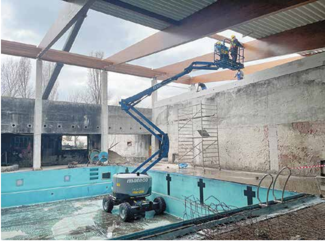
A tetőfedő lemezek beemelését és elhelyezését az uszodateréből emelőkosaras berendezéssel segítik a felújítást végző cég munkatársai

A leégett rákosszentmihályi uszoda újjáépítésének munkálataira kiírt közbeszerzést a jónevű Ép-Kar Zrt. nyerte meg, akik egyúttal a Csobaj utcai nyugdíjházhoz és a Lándzsa lakótelepi új bölcsőde építését is végzik. Az uszodánál a beruházó, a tervező és a kivitelezők képviselői hetente szerdán tartanak konzultációt, március 13-án velük tartott lapunk munkatársa is.