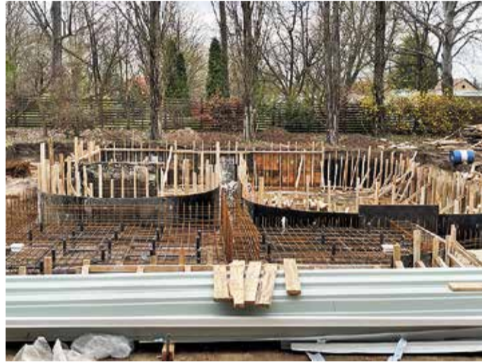
Betonozásra vár az új szabadtéri medence