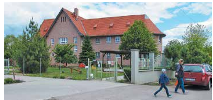
Tejlesen megtelt óvodással a kétszintes épület, emiatt konténer-oviban kell új csoportot indítani

- A változás egyébként a községi könyvtárat is érinti, ami eddig községi szolgáltató rendszerben a Pest megyei könyvtárhoz tartozott, de mivel szintet léptünk a lélekszámban, jövő januártól önálló intézményként működik a továbbiakban. (Ferenc)