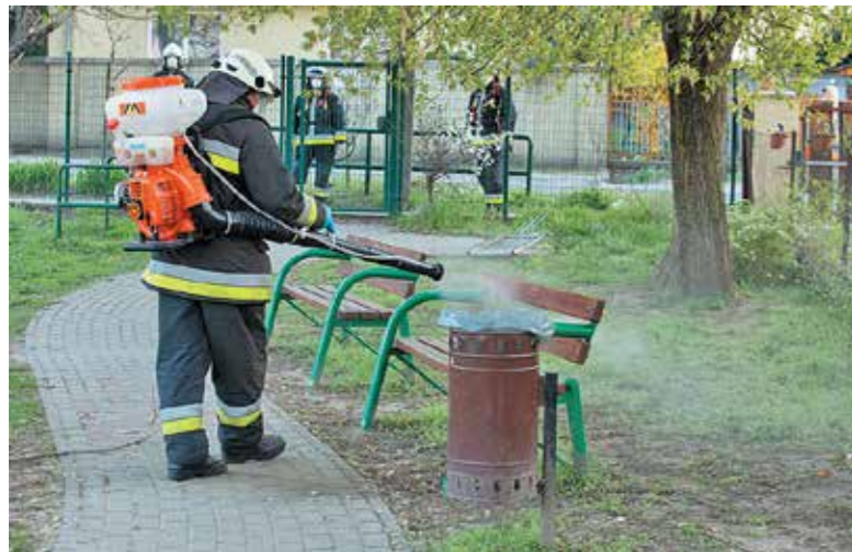
A csömöri önkéntes tűzoltók védőfelszerelésben fertőtlenítik a közterületi padokat

A csömöri nevelési intézmények, bölcsődék és óvodák május végétől újra a megszokottak szerint működnek, változás azonban, hogy idén egész nyáron nyitva lesznek. Az intézményeket megnyitásuk előtt az önkormányzat a csömöri önkéntes tűzoltók közreműködésével fertőtlenítette. Ugyanígy, fertőtlenítést követően vehették birtokba a családok a település közösségi tereit, a játszótereket, a kondi parkokat és a pihenőparkokat. Ugyanakkor az az önkormányzat azt javasolja, hogy a felnőttek a közösségi tereken való folyamatos tartózkodás esetén lehetőleg viseljenek szájmaszkot vagy az orrot, száját eltakaró kendőt, sálát.