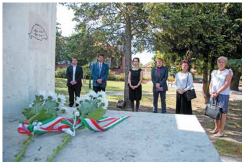
A csömöri önkormányzat vezetői megemlékezést tartottak Trianon 100. évfordulója alkalmából

A Trianoni békeszerződés 100. évfordulójának alkalmából június 4-én reggel az önkormányzat vezetői felvonták az országzászlót Csömörön a Hősök terén található első világháborús hősi emlékműnél. A jelenlegi járványügyi helyzet miatt arra kértek minden helyi szervezetet, intézményt és csömöri polgárt, hogy a nap folyamán egyénileg helyezzék el az emlékezet virágait az emlékmű lábánál.