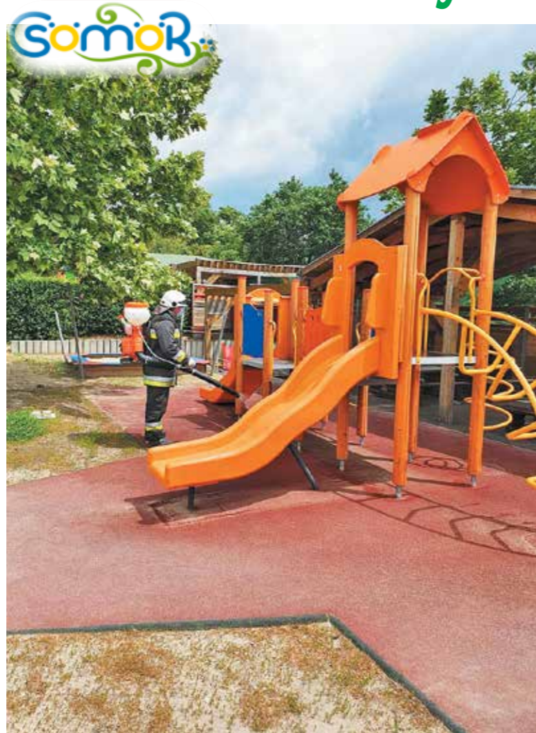
Fertőtlenítés után nyitották meg kapuikat csömörön a nevelési intézmények és a játszóterek