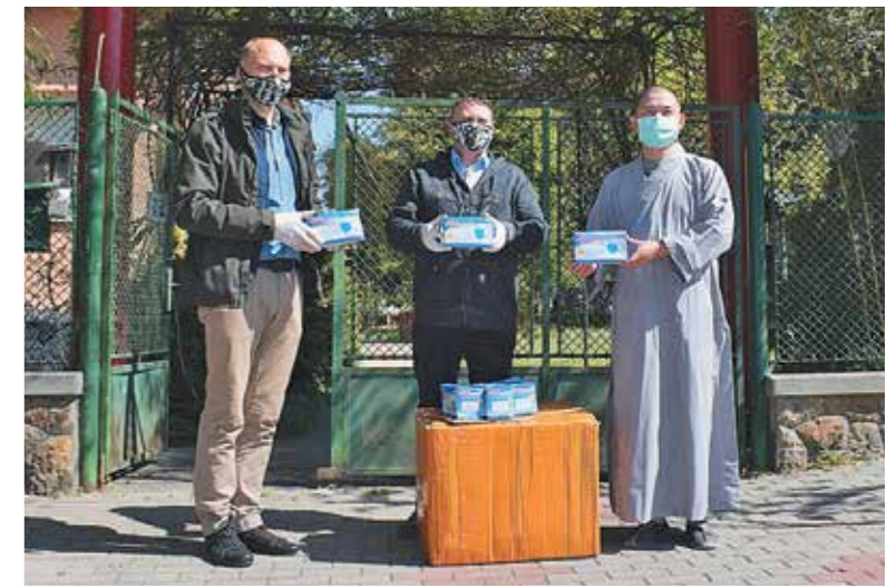
A Magyarországi Kínai Chan Buddhista Egyház Cinkota, Rádió utcai Pu Ji Templom közössége 2700 darab orvosi maszkot ajánlott fel a védekezésben résztvevők számára

Hella, női-férfi fodrász Tel: 06-20-410-3538