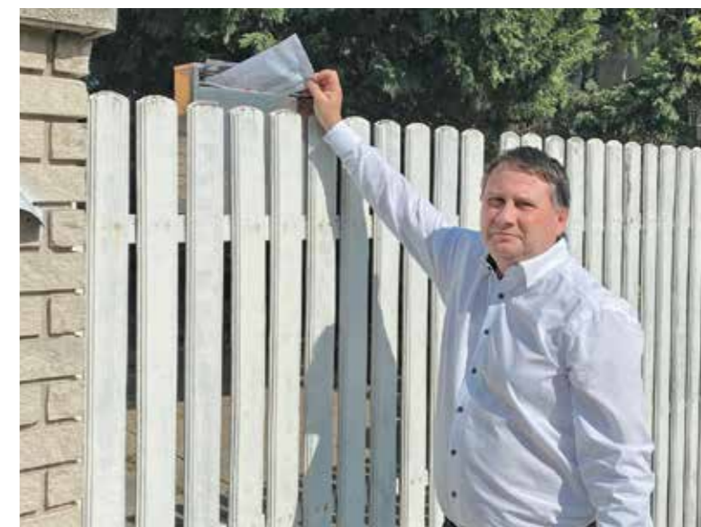
A polgármester személyesen is kivette részét a feladatokból

- Milyen módon sikerült az ellátásokat megszervezni? - Az idősek ellátásának igényléséhez fenntartottunk egy külön