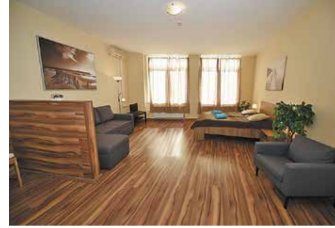
Egy apartman a Veres Péter úti Mátyás Hotelben

A Szállásinfo szakmai portál szerint a hosteleket is beértve Zuglóban 71, a XVI. kerületben 5, de a Booking.com nyilvántartásában ugyanitt 13 szálláshely működik.