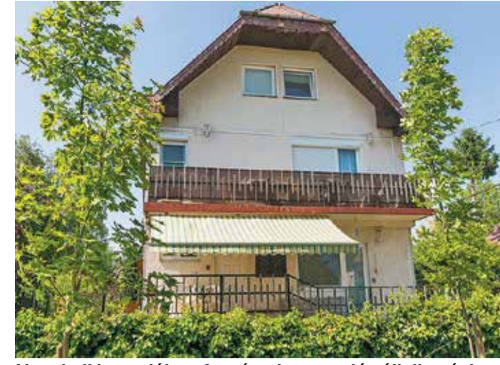
Nem kell kacsalábon forgó palota egy jó vállalkozáshoz: a T1 Budapest épülete a Tőpart utcában

Az egyetlen cég, amivel szerződésben állnak, a Booking.com a vendégeik 90%-át hozza. Mivel többnyire autóstól közelítő külföldi gyerekes családó-