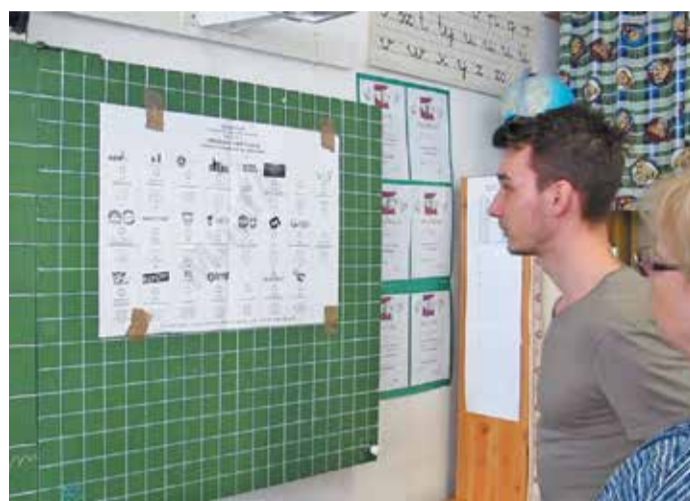
Választók ismerkednek a terjedelmes listás szavazólapal a 13. választókerület 26. szavazóköriében

...jön-e még a Mikulás, miután a Semjén Zsolti bácsi ki-lította messzi északon a rénszarvast...? 3. oldal