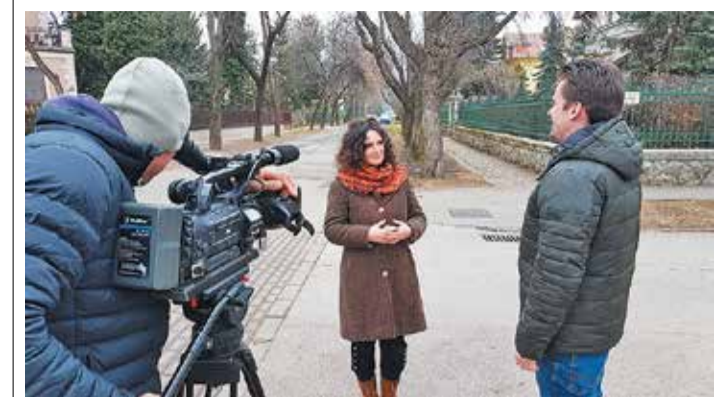
Forgatás a mátyásföldi sétán

ÁPRILIS 22-jén 10.00: A CAPRERA-FORRÁSTÓL a vadregényes Csobaj-bányáig – természetseta. 28-án 10.00 MÁTYÁSFOLD LEGSZÉBB VILLÁI. A Pílóta utca védett villái, templomok, Dozzi-villa. 28-án 14.00 CINKOTA A-Z-IG: tájház, templomok, öregtemető és az iskola pince-múzeuma. A tájház rendezvényén bepillantunk az állatkihajtáshoz kapcsolódó munkákba, és megnézzük, hogyan készülnek a cinkotai hímzések. 29-én: A BAROKK CSODA: VÁC – egésznapos kirándulás, helyi idegenvezetővel, múmiaállítással, Sajdik Ferenc váci mosolybuzával, szemgyógyító csodaforrással. MÁJUS 13-án 14.00: CSOKIMÚZEUM ÉS ÁRPÁDFÖLD nevezetességei, csokikóstolással. 6 éven felülieknek! 19-én: A rekordok városa: VERESEGYHÁZ, Medveothonlátogatással (az időpont változhat). 20-án 14.00 KASTÉLYTÓL KILÁTÓIG: Nagycicótól Sas-halomig, határkövel, templommal, parkokkal, új kilátóval a Reformátorok terén. 21-én 14.00 A NAPLÁS-TÓ REJTŐZŐ KINCSEI - a zoológus szemével. Séta a kiserdőben, tókerülés, állatok és növények felfedezése és megismerése (pünkösdi hétfőn). 27-én: Varázslatos GÖDÖLLŐ III – egésznapos városnézés (az időpont változhat). 28-án 14.00 SÉTA A FIUMEI ÚTI TEMETŐBEN, a 16. kerület nagyjai után kutatva, Batthyány, Kossuth, Deák mauzóleumlátogatásokkal (hétfőn).