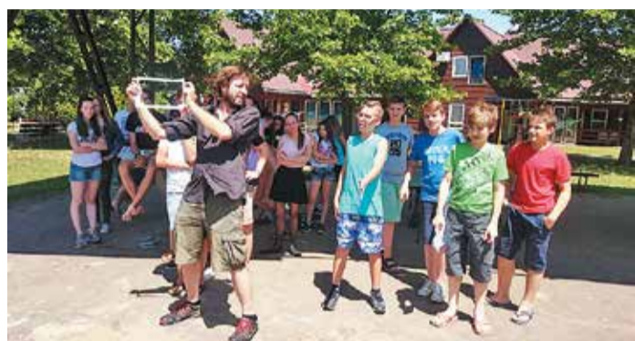
Médiatábor: 2017-ben Maly Róbert, az Oscar-díjas Mindenki operatőre tartott bemutatót

soknak vagy testvérrel érkezőknek vagy a 10.000 Ft előleget április 30-ig átutalóknak.