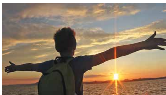
Médiatábor a Balatonon.

Információ: cikkek, fotók, videók a régi táborokról: http://mediatabor.uw.hu ; telefon: 20/9310-800; email: mediatabor@gmail.com .